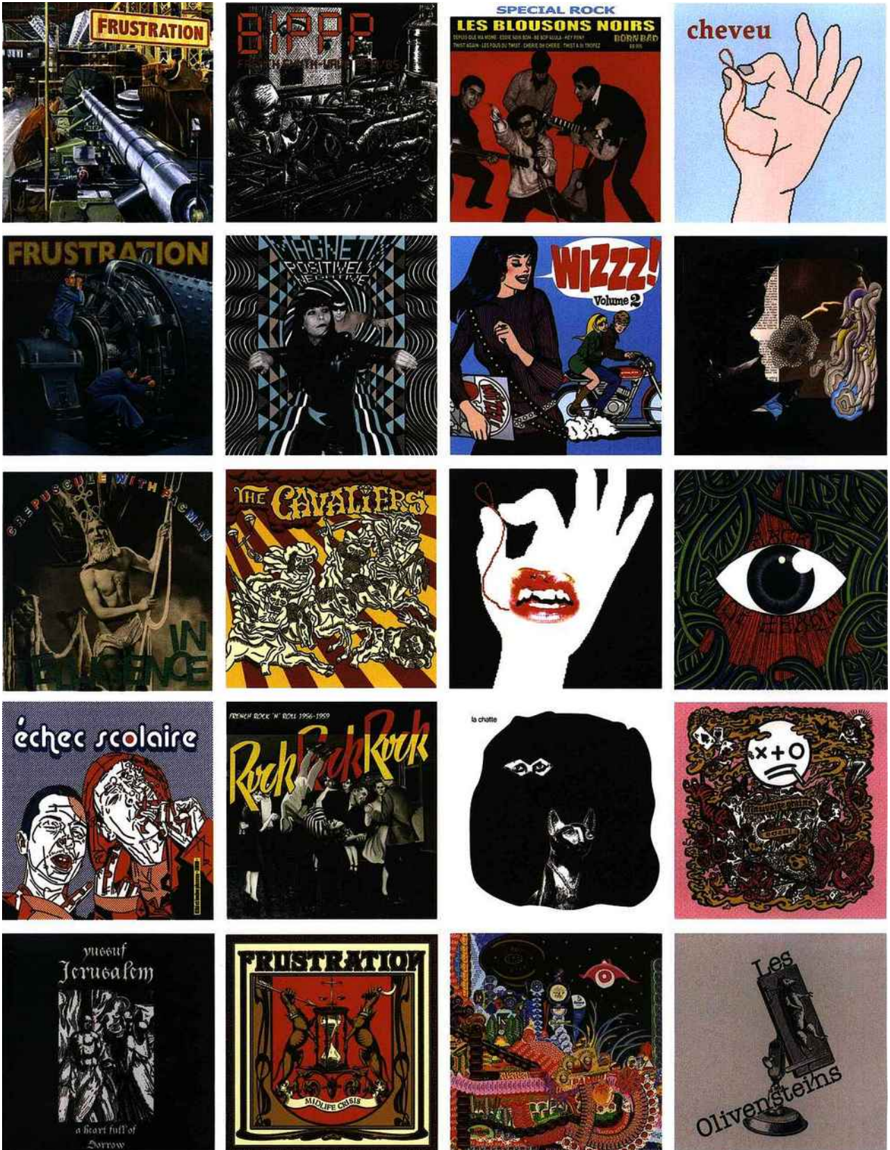
1. Frustration: Baldo 2. Bipp: Baldo 3. Les Blousons Noirs: Born Bad Records 4. Cheveu: Bill Gates 5. Frustration: Baldo 6. Magnetix: Elzo 7. Wizzz!: Rock 8. Dirty French Psychedelics: Elisabeth Arkhipoff 9. Intelligence: Lars Aldric Finberg 10. The Cavaliers: Chaos 11. Cheveu: Cheveu 12. Jack Of Heart: Elzo 13. Echec Scolaire: Bazooka 14. Rock Rock Rock: Baldo 15. La Chatte: Vava Dudu 16. Mauvaise Graine: Winshluss 17. Yussuf Jerusalem: Yussuf Jerusalem 18. Frustration: Elzo 19. Cheveu: Chaix 20. Olivenstein: Le Petit Larousse